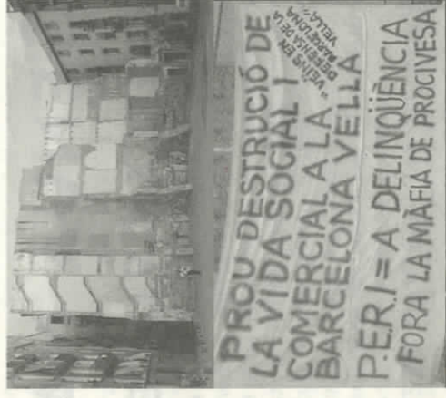
Speculatie met onroerend goed en de sociale zuivering die hiermee gepaard gaat is in Barcelona een belangrijk actiethema