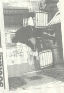
uit de krant (1998)